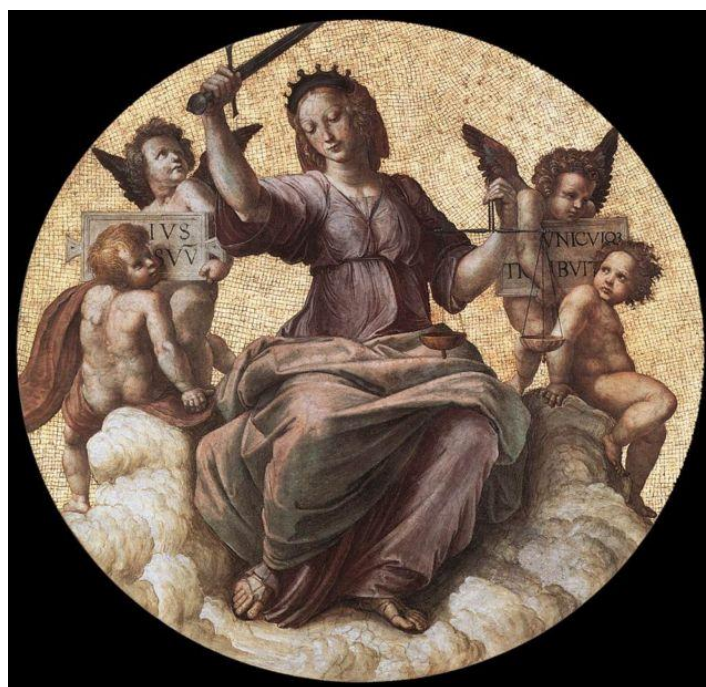
Justice, from the 'Stanza della Segnatura' by Raphael Sanzio. 1511.

Она ведет свое происхождение от Мирных проектов, разработанных философами XVIII века и особенно от проекта вечного мира Канта, который предсказывал создание со-