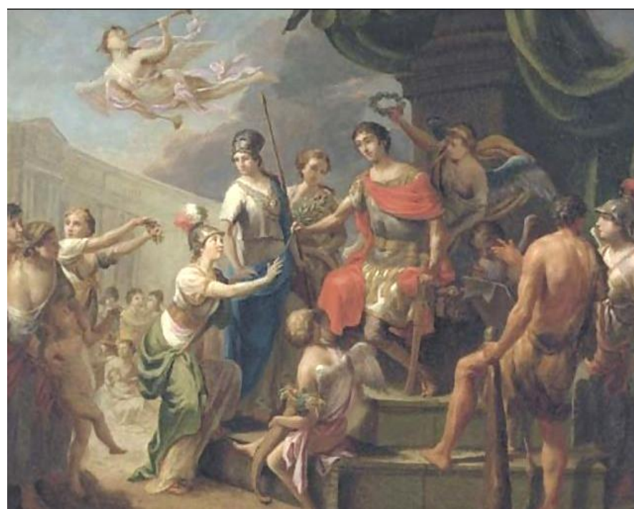
The Triumph of a Roman Emperor by Gerard De Lairese. Late 17th c.

Theoretically, realizing peace through an empire represents a pretty radical solution because it confides to an absolute sovereign force (either the force of a state or the force of a state coalition) the care to render war impossible. For example, nuclear weapon has been the opportunity, in the middle of the 20th century and during the Cold War, to consider that the exclusivist domination of an empire could by itself avoid the apocalypse, the most eminent quality of an empire being the force to eliminate all its rivals.